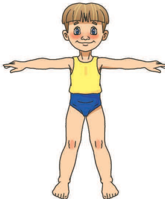
Hands up, to the sides.