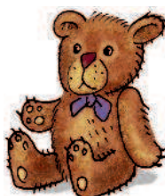
teddy bear / old