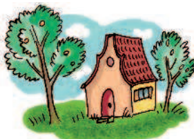
house / small