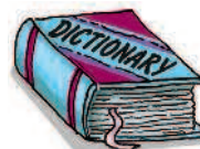
dictionary / useful