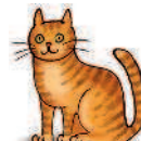
Fluffy / she