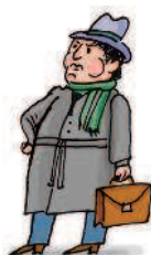
person / important