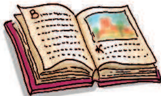
book / interesting