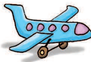
aeroplane / blue

9 Выучи последовательность, в которой прилагательные употребляются перед существительным.