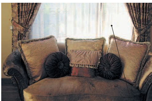
curtain [kɜːtɪn] кэ:тн портъера